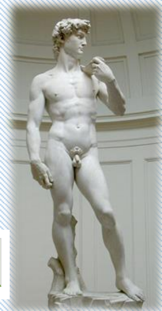
Michelangelo Buonarroti, David, 1501-1504, marmor

Zapomnimo si, da pri upodabljanju figure odraslega človeka upoštevamo razmerje 1 : 7, kar pomeni, da je višina glave osmina višine človeka.