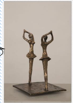
Slavko Krajnc, Balet, 1977, bron