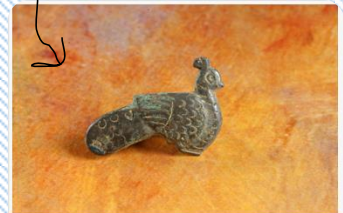
Fibula v obliki pava, 1.-2. stoletje n. št., bron